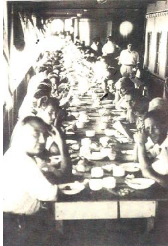
En ple viatge en el vaixell Nyassa. Maig de 1942. Fons Gabriela Hernández Palet

por ventanas, puertas, etc. Caminamos por un largo tiempo por una carretera, era el cansancio mezclado con un terrorífico pánico que la gente no podía más teniendo que tirar las maletas con todas sus pertenencias. A mi padre se lo llevaron a un campo de concentración y a nosotras tres, mi madre (Carmen), mi hermana (Ramona) y yo a un asilo de ancianos, donde las mujeres lavaban la ropa para poder darles de comer a sus hijos.” 27